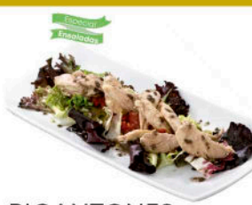
PICANTONES DESHUESADAS en Escabeche