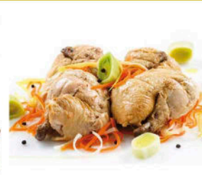
POLLO PICANTÓN EN ESCABECHE