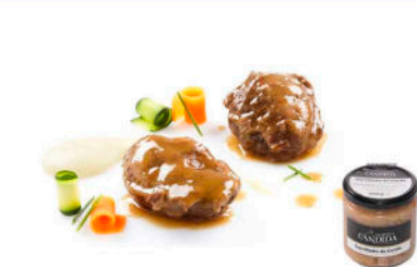
CARRILLADA DE CERDO con Salsa de Vino Tinto

Formato: Peso neto: 400g / 12 und por caja