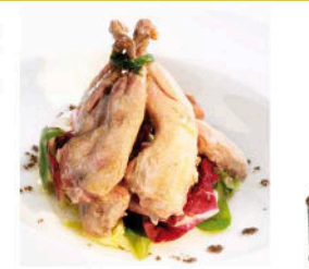
MUSLITOS DE CODORNIZ EN ESCABECHE 10 unidades