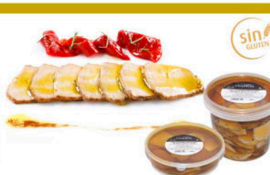
LOMO DE ORZA FILETEADO en Aceite de Oliva Virgen Extra o en Aceite de Gorasol

Formato: Peso neto 400g / 12 und por caja Peso neto 1825g / 4 und por caja