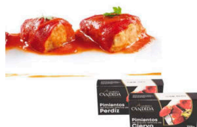
PIMIENTOS DEL PIQUILLO