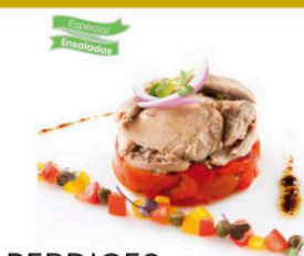
PERDICES DESHUESADAS en Escabeche