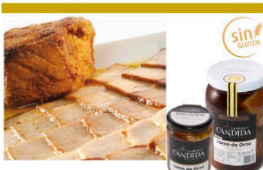
LOMO DE ORZA en Aceite de Oliva Virgen Extra

Formato: Peso neto 220g / 25 und por caja