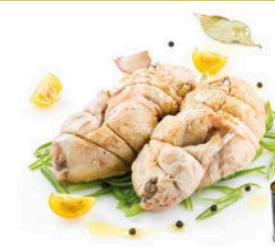
PERDIZ EN ESCABECHE