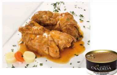
PERDIZ ESTOFADA a la Toledana

Formato: Peso neto: 400g / 12 und por caja