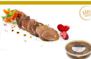
CIERVO FILETEADO en Aceite de Oliva Virgen Extra

Formato: Peso neto 570g / 4 und por caja Peso neto 1500g / 2 und por caja (en AOVE o en Aceite de Girasol)