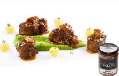
RABO DE TORO ESTOFADO

Sugerencia de Preparación: Calentar en microondas sin tapa, o en una cacerola, durante 2-3 minutos.