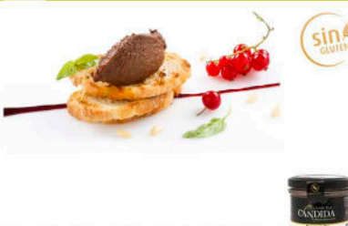
PASTEL DE MORCILLA Y PIÑONES

Formato: Peso neto 110g / 12 und por caja