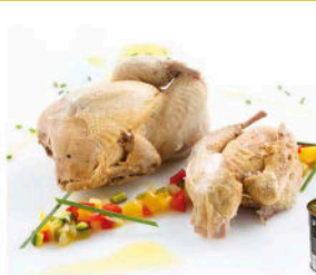
CODORNICES EN ESCABECHE 2 unidades